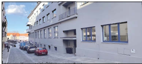
Obchodní zastoupení REZULT PLUS, Velké nám. 27, Písek – vchod z ulice Fr. Šrámka.